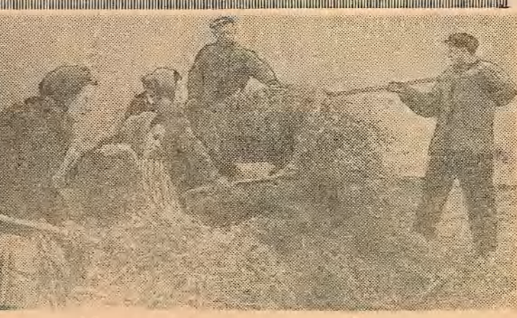
Студэнты III курса хімічнага факультэта сіласуюць кармы для жывёлы ў калгасе «Сталінскі шлях».

Калі на дапамогу ў наш калгас прыехалі студэнты трэцяга і чацвёртага курсаў фізіка-матэматычнага факультэта, усе мы былі вельмі ўрадаваны. Як жа—90 юнакоў і дзяўчат—гэта вялікая сіла. І першыя дні працы на палях сельгасарцелі поўнасьцю падцвердзілі такую думку. Нашы памочнікі працавалі добра, стараліся не адставаць ад хлебарабаў. Асабліва стараннай работай вызначаюцца студэнты, якія працуюць у трэцяй паліводчай брыгадзе (кіраўнік тав. Раскіна) і ў першай паліводчай брыгадзе. На працу яны заўсёды выходзяць своечасова, ніколі не спазняюцца, усе загады і даручэнні брыгадзіраў выконваюць бездакорна. Ёсць хача-б у трэцяй брыгадзе была такая справа: студэнты малацілі азмяя збожжавыя. Аднойчы да канца працоўнага дня заставалася яшчэ не абмалочаным амаль палавіна вялікай шырты. А на небе набеглі хмары, мог пайсці дождж. Каб не пакінуць шырты пад дажджом, студэнты дружна наляглі на малацьбу і скончылі малацьбу ў 11-ай гадзіне ночы. Калгаснікі шчыра дзякавалі іх за самаадданую працу.